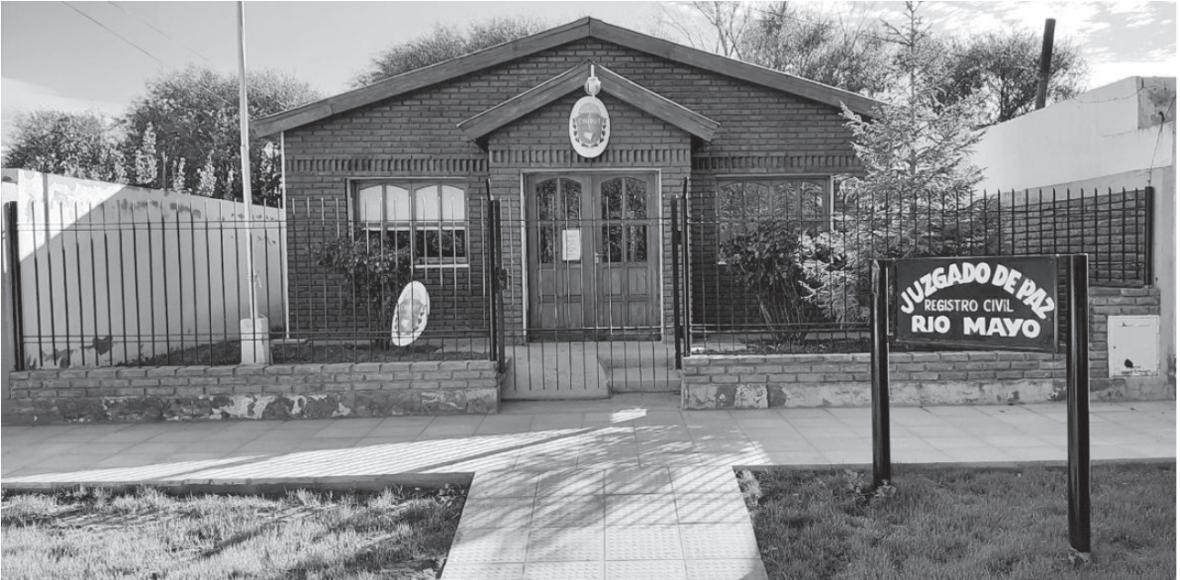
Juzgado de Paz de Río Mayo

Magistratura y otros por elección popular. Estos jueces cuyos juzgados son cabeza de jurisdicción van a pasar a ser Jueces de Paz Letrados, va a adquirir los mismos derechos y obligaciones que los jueces letrados que son elegidos a través del Consejo de la Magistratura y cuyo pliego debe contar con la aprobación de la Honorable Legislatura. Hoy, por ejemplo, se eligen a través del Consejo de la Magistratura pero sus pliegos son aprobados por los respectivos Consejos Deliberantes. Esto además, va a permitir otorgarles mayores competencias entre las que se pueden señalar de Ejecución y Civil y Comercial. Uno de los objetivos también es lograr descomprimir un poco los juzgados de ejecución y los juzgados civiles y comerciales de cada circunscripción. Esto también provee una jerarquización de la Justicia de Paz y en este aspecto se va a tener una mejor práctica de las competencias asignadas y se podrá llegar de manera más profesional y certera a la sociedad.