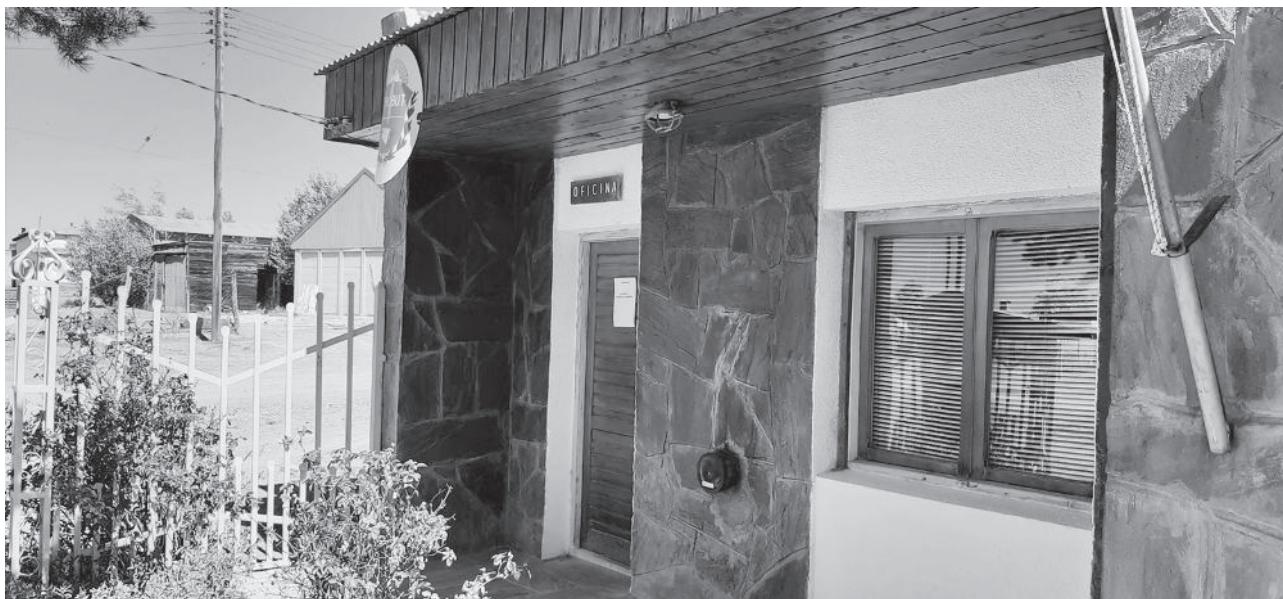
Juzgado de Paz de Languiño

Venimos realizando capacitaciones en las distintas circunscripciones. Hemos hecho Río Mayo y toda la zona sur, también hace pocos días hechos llevado a cabo un proceso de capacitación en Lago Puelo con todo lo que significa la Comarca y las ciudades del Noroeste. En cuanto a Rawson ya hemos realizado la capacitación correspondiente a Rawson y nos falta lo que es la Meseta. Capacitación no solo en lo que respecta a lo que son los procesos contravencionales, marcas y señales y registro civil, sino que ha partir del 1° de diciembre, por ejemplo, se llevó a cabo una capacitación para los empleados de los Juzgados de Paz en los Juzgados de Ejecución para que vayan conociendo como es el proceso, desde el ingreso de un expediente hasta el dictado de una sentencia, es decir, lo que se viene. También habrá una capacitación brindada por personal de la Secretaría de Informática Jurídica para el manejo del sistema Libra que es el que van a utilizar los juzgados de paz para que los empleados se vayan familiarizando con la búsqueda y carga de expedientes. De este modo vamos trabajando para llegar del mejor modo posible y con el mayor conocimiento adquirido por todos los integrantes de cada juzgado.