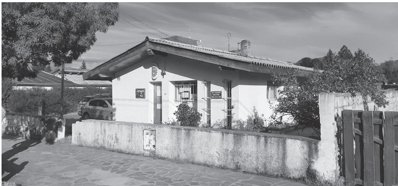
Juzgado de Paz de Trevelin

Exactamente. Y no solo que realiza tareas jurisdiccionales sino que también abarca tareas del Poder Ejecutivo como son el Registro Civil, Marcas y Señales, es decir, tienen una comunicación en todo sentido con la comunidad, Violencia de Género, Violencia Familiar, lo Contravencional, o sea que tiene un amplio espectro de competencias que le da un tipo de comunicación con la sociedad, único en el sentido de la capacidad para resolver los problemas que se puedan presentar en la comunidad. Es decir, tiene una naturaleza de promover la paz social. Entonces, a lo que se apuntó con las distintas normas y herramientas que a esta oficina le han dado los ministros es para que al juez de paz lo sociedad lo pueda visualizar como un funcionario proactivo, y esto es lo que estamos logrando a través de la capacitación y de estar más cerca, recorrer los distintos juzgados, dialogar con ellos y tener, además, entrevistas con los jefes comunales, con el médico o con el responsable de la sala de primeros auxilios, con la policía, con la escuela, y trabajar mancomunadamente con ellos también.