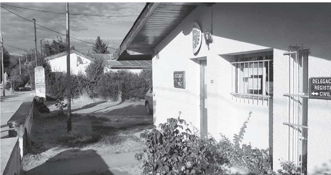
Juzgado de Paz de El Hoyo

De acuerdo a la ley esto se va a hacer de forma progresiva a partir de los vencimientos de los mandatos que hoy tienen los jueces de paz. Y se va a comenzar con las cabezas de circunscripción, es decir, Rawson, Trelew, Puerto Madryn, Comodoro Rivadavia, Esquel, Sarmiento y Lago Puelo.