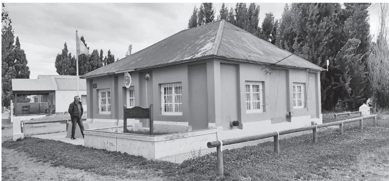
Juzgado de Paz de Alto Río Senguer

Bien, se encuentra bien. Hemos trabajado mucho durante la pandemia a pesar de los contratiempos que supuso esta crisis global. Hemos aprovechado para hacer una actualización a través de un minucioso trabajo, específicamente en lo que se refiere al aspecto edilicio de cada uno de los juzgados de la provincia.